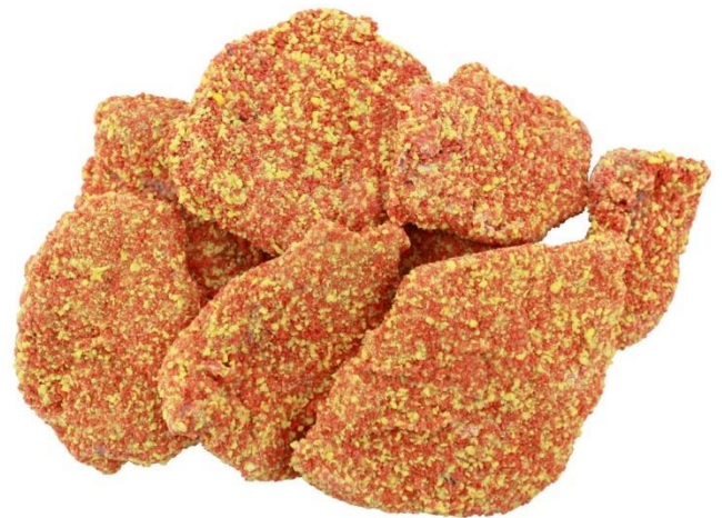
Raspaðar hráar kótilettur eru seldar í 5 kg pakkningum

Verð til félagsmanna er 2.126/kg fyrir hráar og 2.462/kg fyrir forsteiktar. Vsk leggst við í báðum tilfellum.