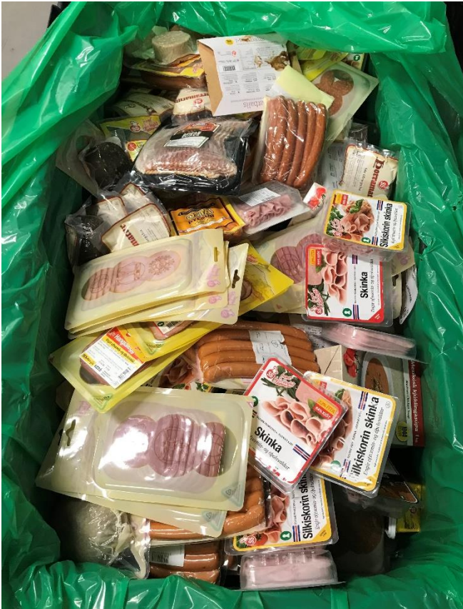
Skilavörur á leið í urðun

SS er að innleiða tvívíð strikamerki sem auðvelda að draga úr þessari sóun og að vörur sem fara inn í verslanir séu seldar þar en ekki skilað. Allt annað er neikvætt umhverfislega og hækkar vöruverð.