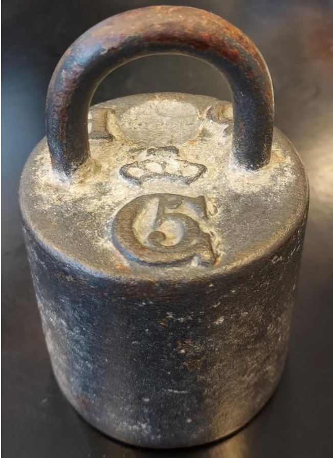
Fimm punda lóð frá 17. Öld

Það er því allt sem bendir til þess að lóðið sé frá 17. öld og er skemmtileg viðbót við minjasafn SS.