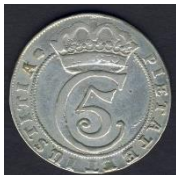
Peningur frá tíma Kristjáns 5. með sama merki og er á lóðinu